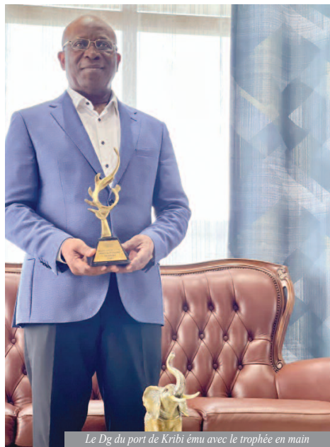
Le Dg du port de Kribi ému avec le trophée en main