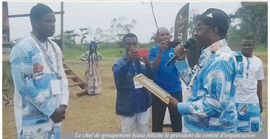
Le chef de groupement Iyasa félicite le président du comité d'organisation

rennir la langue et la culture. On peut citer le Comité d'Étude de la langue Iyasa (CELI) qui est exclusivement axé sur les travaux d'écriture et d'harmonisation de l'écriture Iyasa en passant par la traduction de la Bible en langue Iyasa. Soutenu par la SIL-Cameroun, le CELI a pu élaborer un système d'écriture de la langue en adéquation avec l'alphabet général des langues camerounaises.