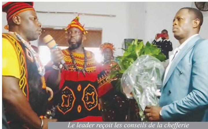
Le leader reçoit les conseils de la chefferie