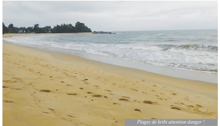
Plages de Kribi attention danger !

tion des baignades de manière temporaire et provisoire sur toutes les plages de Kribi. Le temps que la mer se calme. Et nous mettons l'accent sur la sensibilisation des visiteurs et des riverains, pour qu'ils s'abstiennent pour le moment de se rendre à la plage » martèle Nouhou Bello.