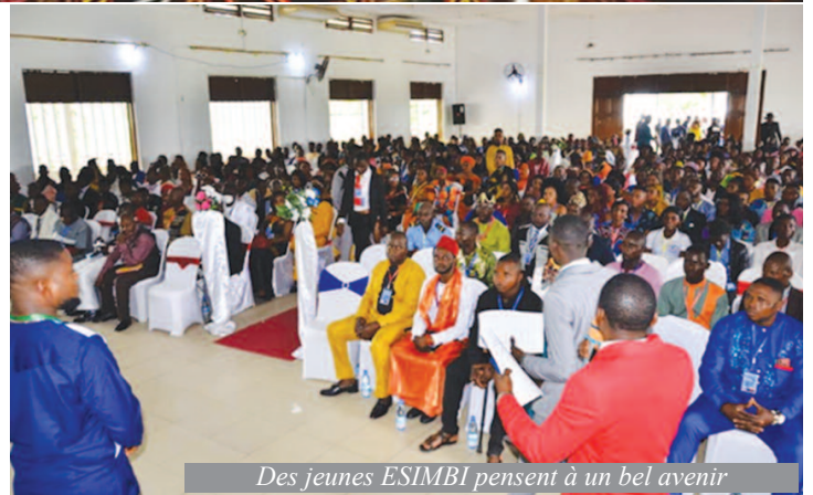
Des jeunes ESIMBI pensent à un bel avenir

He went on to announce the association's major projects for the upcoming years. The town of Kribi, host to this important delegation from the hills of the Menchum Valley, will benefit from an ultra-modern cultural centre. It will be built to enable the sons and daughters of Benakuma to rekindle the flame of their belonging to the Esimbi people. A chain of solidarity will also be created to promote education and socio-professional integration through the organisation of school and university excellence days. It should be noted that the Esimbi Youths Association's annual national convention raised hopes for a brighter future for the Esimbi people of Cameroon.