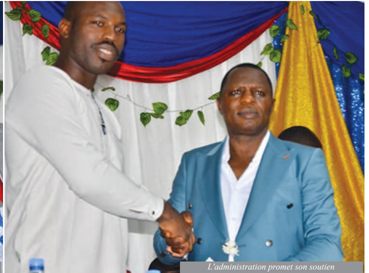
L'administration promet son soutien