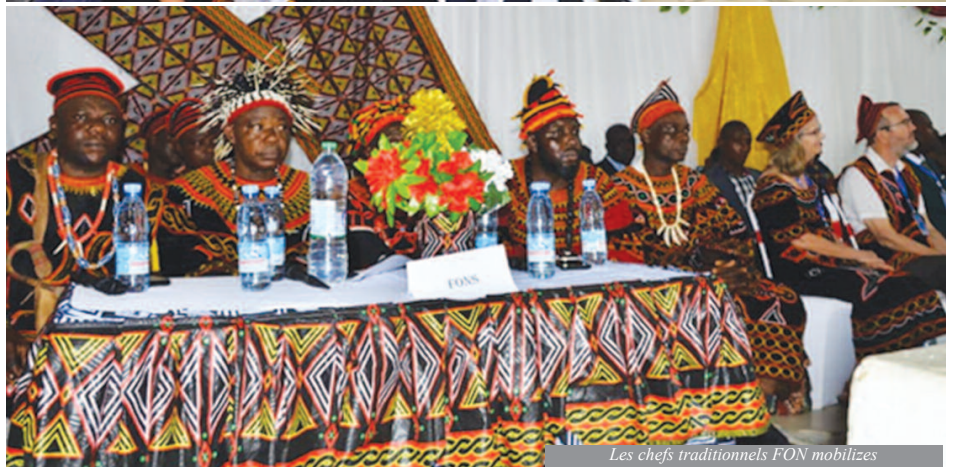
Les chefs traditionnels FON mobilisés