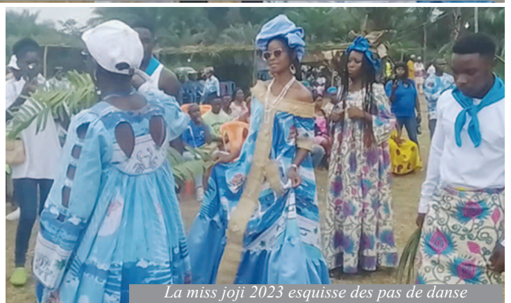
La miss joji 2023 esquisse des pas de danse

Les regroupements Iyasa Ébóo et le Camp de vacances sont d'autres plateformes d'échanges et de partage d'expérience qui permettent aux jeunes enfants et adolescents Iyasa de se reconnecter avec leur culture et d'apprendre les valeurs propres à ce peuple, reconnu pour son hospitalité légendaire. Il devient donc plus qu'important de créer une symbiose autour de ces actions qui ont un seul objectif principal: valoriser le peuple Iyasa aux yeux du monde.