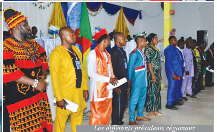
Les différents présidents régionaux