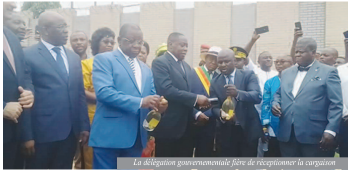
La délégation gouvernementale fière de réceptionner la cargaison

Cette solennité présidée par le mincommerce consacre définitivement au Cameroun la mise