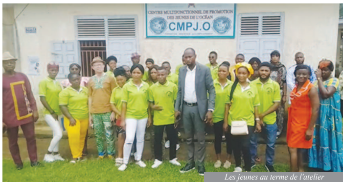
Les jeunes au terme de l'atelier