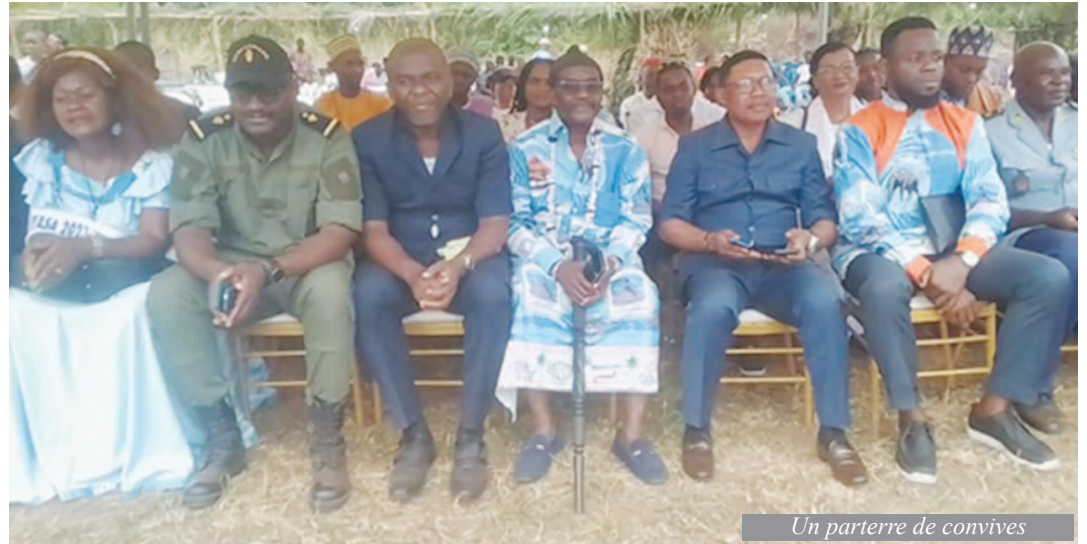
Un parterre de convives

Il est évident que plusieurs actions, outre le Joba ja Iyasa sont mises sur pieds à la fois pour promouvoir, revitaliser, documenter et pé-