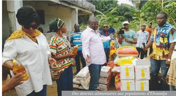
Des denrées alimentaires aux populations d'Eboundja

C'est ainsi que dans ses bagages se trouvaient un ensemble de denrées alimentaires constitués de près d'une dizaine de sacs de riz, des sacs d'oignons de 50kg, des sacs de sel, des palettes de poisson, des cartons de bouteilles d'huile raffinée (...) le tout couronné par un bœuf de 400 kg d'une valeur de 600.000fcfa. Les bénéficiaires en étaient tout émus. « Cette femme est d'une générosité débordante. Nous sommes très fiers de son élan de cœur. Nous accueillons ce geste avec beaucoup de joie » exulte le chef du village Eboundja 1 sa majesté Manè Rolland. René Deme, jeune opérateur économique, notable de 3e degré dans la localité lui fait l'écho. « Il me manque des mots pour qualifier ou pour analyser les gestes de madame le maire de la